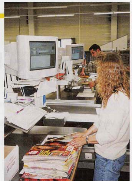
Arbeitsalltag bei Buch und Presse

verschiedenen Arbeitsschritte auf diesem Produktionsweg war für die meisten Besucher Neuland.