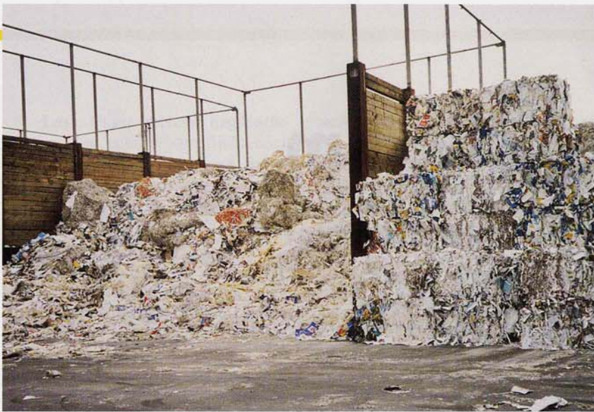
Remittenden zu Copierpapier: Altpapier-Verarbeitung bei Steinbeis-Temming