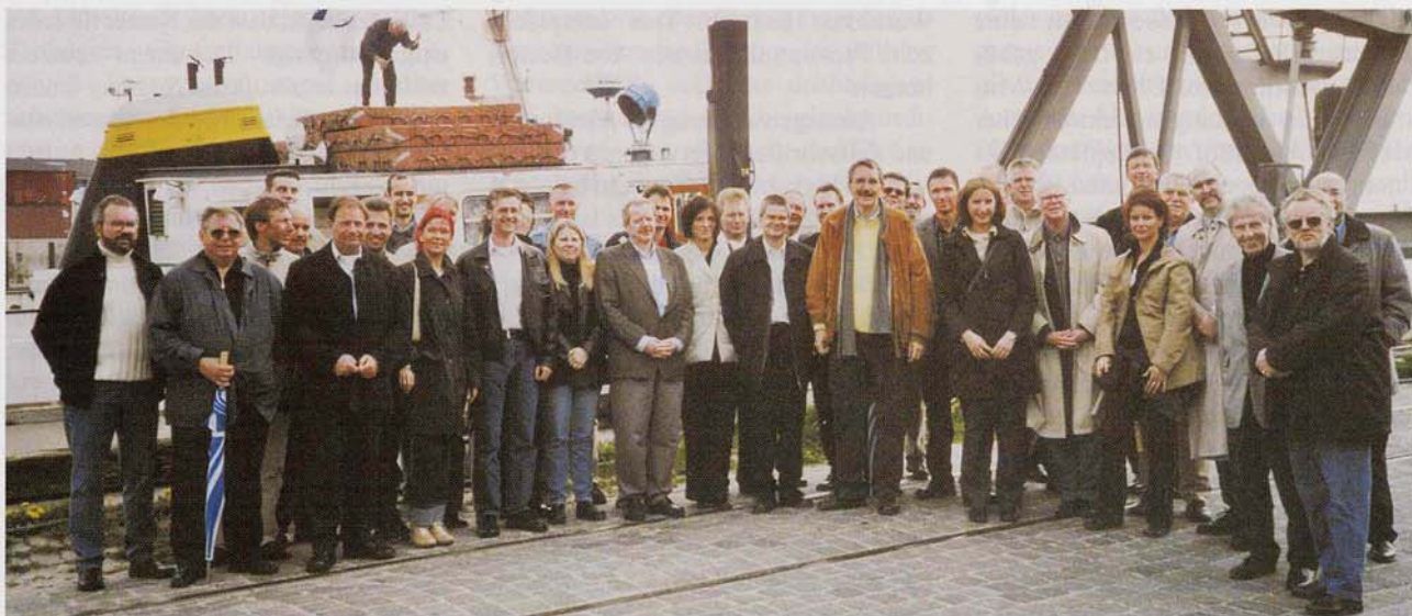
Gemeinsamer Blick nach vorne: Der Hamburger Grossist Buch und Presse und Partner aus dem Handel

lud Verlagsvertreter zu einem spannenden Informationstag ein.